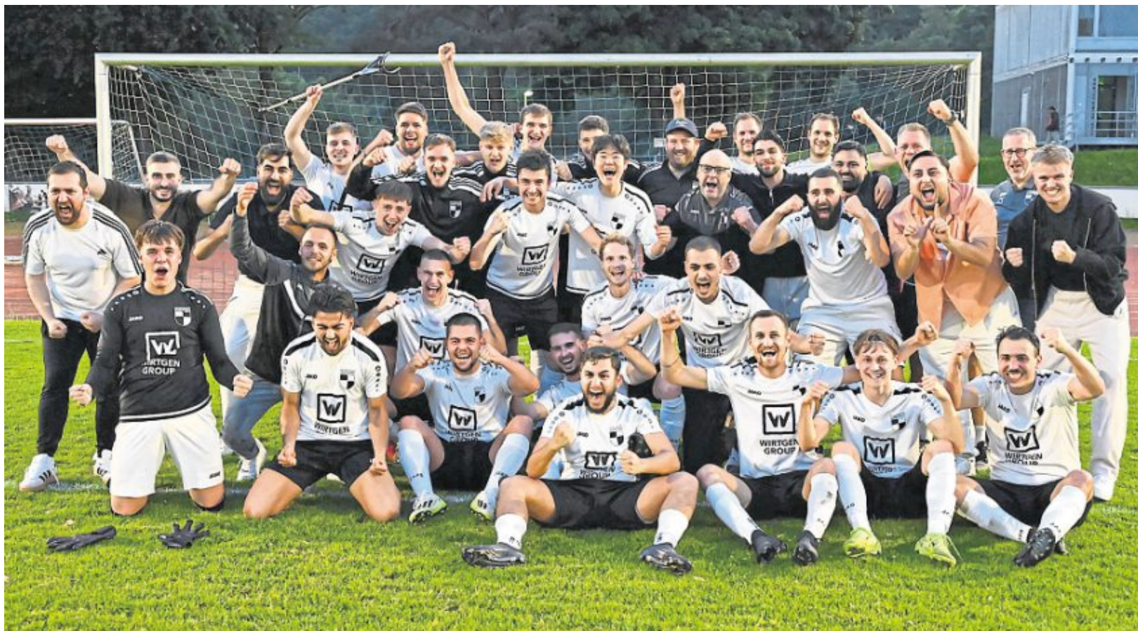
Jubel: Nach der Enttäuschung im letzten Saisonspiel in Puderbach dürfen die Spieler und Verantwortlichen des SV Windhagen ihren Gefühlen freien Lauf lassen. Nach zwei Siegen sind sie zurück in der Bezirksliga.